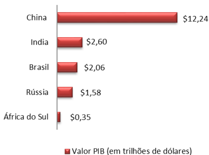
Gráfico 1. Produto Interno Bruto dos BRICS (2017)